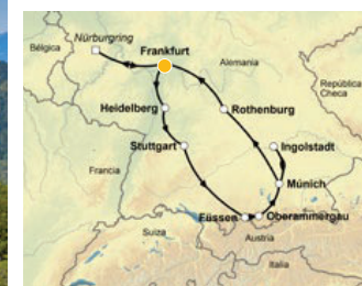
Rothenburg | Alemania